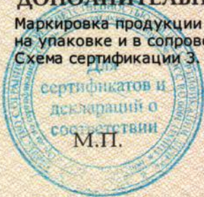
Схема сертификации З.

Маркировка продукции знаком соответствия производится по ГОСТ Р 50460-92. Место нанесения знака соответствия на упаковке и в сопроводительной документации.